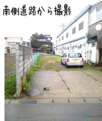
南側道路から撮影