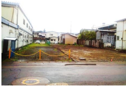
北側道路から撮影