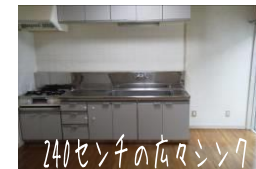
240センチの広タシンク