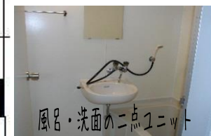
風呂・洗面の二点ユニット